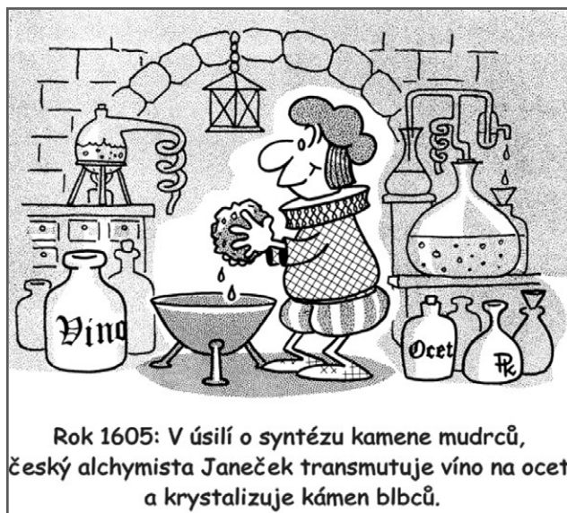
Rok 1605: V úsilí o syntézu kamene mudrců, český alchymista Janeček transmutuje víno na ocet a krystalizuje kámen bílců.

O tom, co dokáže intelektuál s motorovou pilou v ruce, svědčí případ z Benešovska. Učitel základní školy začal prořezávat ořešák způsobem, že usedl na řezanou větev,