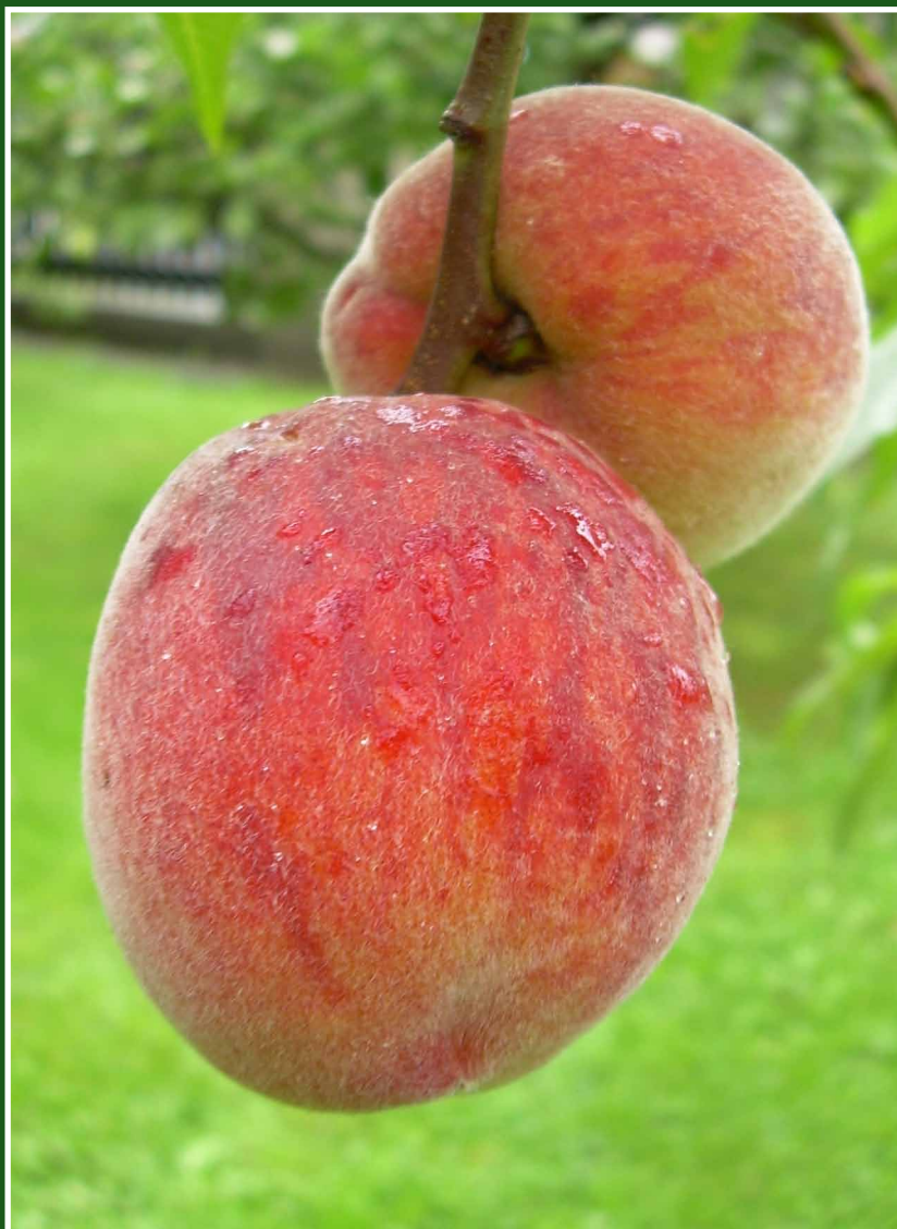
Další letní ovoce - pěkná úroda broskví.