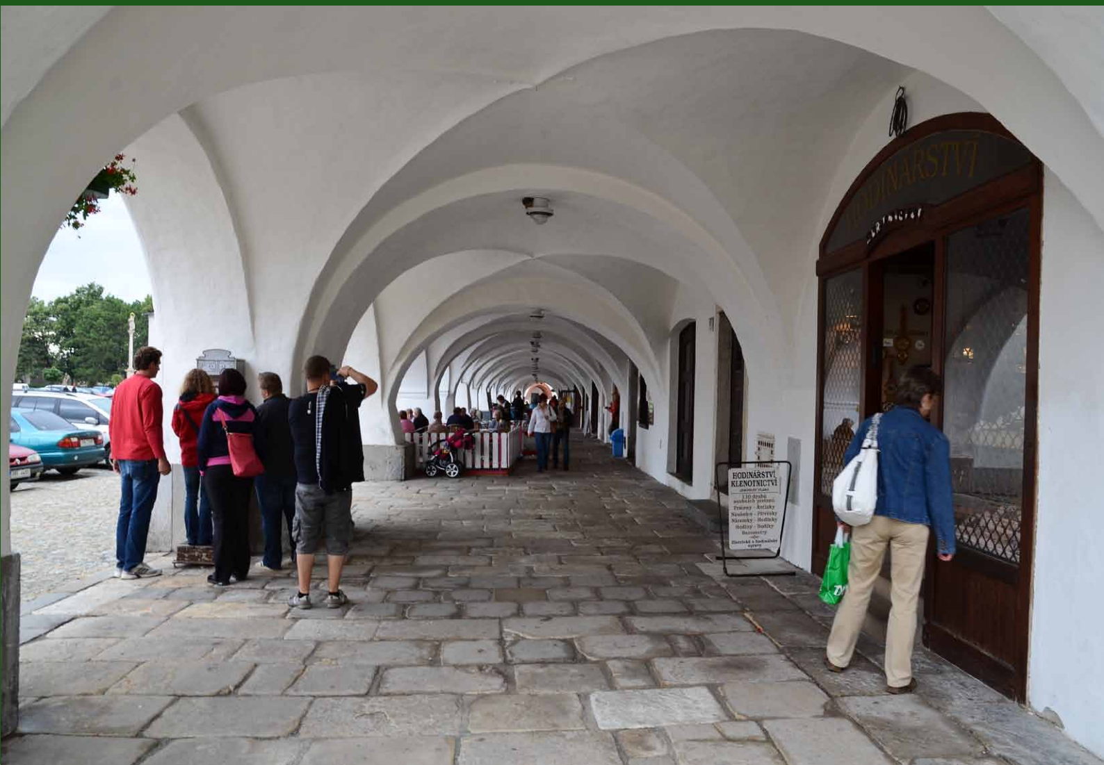
Dobruška náměstí.