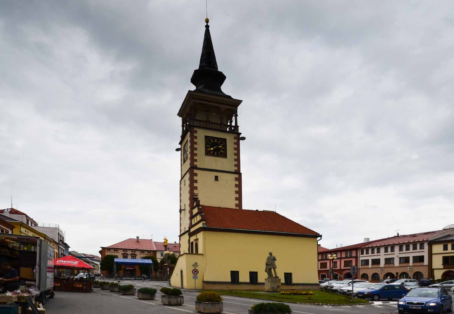
Nové Město nad Metují - podloubí.