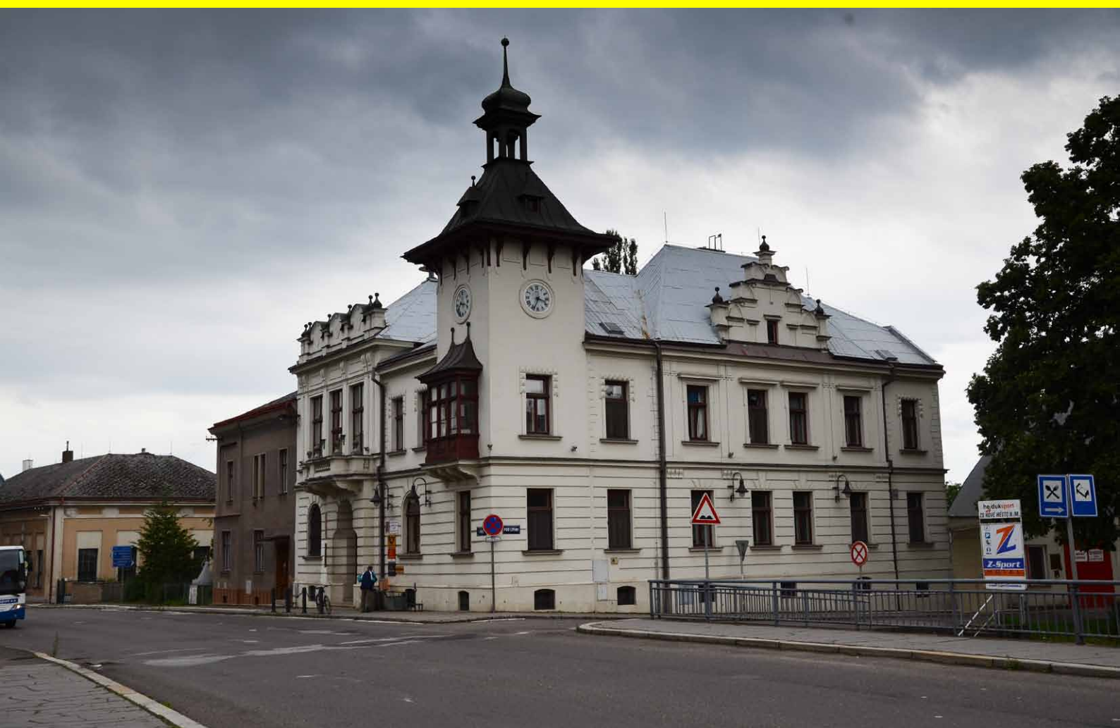
Krčín - bývalá radnice, dnes pošta.

ČLÁNKY - INFORMACE - AKTUALITY - NÁZORY- FOTOGRAFIE